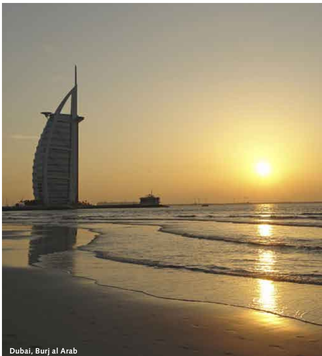
Dubai, Burj al Arab

4. Tag, Muscat: Heute legen Sie in Muscat an. Im Rahmen einer Stadtführung können Sie die schöne Stadt besser kennenlernen. Vom Hafen von Mina Qaboos geht die Fahrt zur Grand Moschee. Sie besichtigen das Bait Al Zubair Museum, einem Gebäude aus dem Jahre 1941. Hier richtete man 1998 ein Museum zur Darstellung einiger geschichtlicher Aspekte Omans ein. Danach geht die Fahrt zur Küstenstraße – der Corniche. Hier besuchen Sie einen sehr schönen Fischmarkt, auf dem die Händler Meerestiere und ihren frisch gefangenen Fisch präsentieren. Danach fahren Sie auf der Promenadenstraße entlang zum farbenfrohen Souq (=Markt) von Mutrah. Arabische Gerüche, Gewürze, Nüsse und Kräuter wie Zimt, Pfeffer, Henna, werden hier für wenig Geld in großen Säcken zum Abfüllen angeboten. Sie bekommen natürlich Weihrauch zum Abbrennen, das Baumharz, was im Süden Omans vom wild wachsenden Weihrauchbaum geerntet wird. Daneben bieten zahlreiche Händler meist aus Indien stammende Schals und Gewänder an. Hier können Sie auch eine Mischung aus Alt und Neu inmitten beeindruckender Kaufmannshäuser aus dem 18. Jahrhundert bewundern.