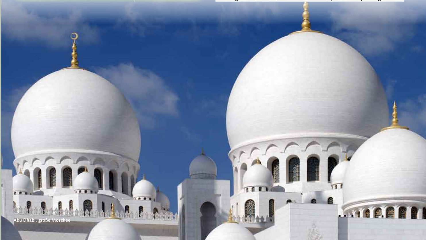
Abu Dhabi, große Moschee