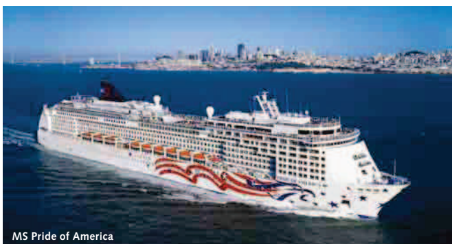
MS Pride of America

10. Tag, Kona: In der Nacht haben Sie Hawaii im Süden umfahren, um heute Morgen in Kona, im Osten Hawaiis vor Anker zu gehen. Die sonnenüberflutete Küste wird gesäumt von den berühmten Kaffeeplantagen, von großen Feldern heranwachsender Macadamianüsse und mehreren geschichtsträchtigen Stätten. Nehmen Sie Teil an einer Entdeckungstour durch die historische Stadt Kona und entlang Hawaiis wunderschöner Gold Coast (Ausflugspaket, siehe „Sonstige Preise“).