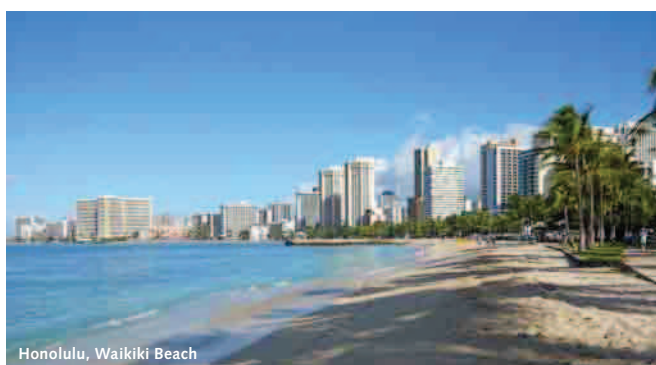
Honolulu, Waikiki Beach