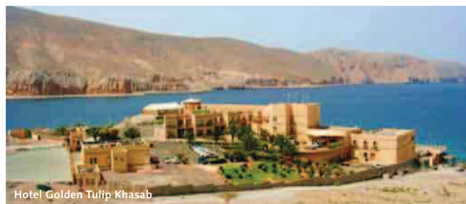
Hotel Golden Tulip Khasab

14. Tag, Muscat – Frankfurt: Kurz nach Mitternacht heißt es leider Abschied nehmen. Sie fliegen mit Oman Air zurück nach Frankfurt, wo Sie am frühen Morgen landen.